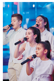
Выступает вокальный ансамбль «Октавиани»