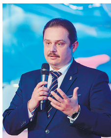
Ректор Самарского государственного медицинского университета А.В. Колсанов