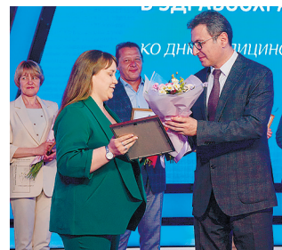
Награды медсестрам вручает министр здравоохранения Самарской области А.С.Бенян